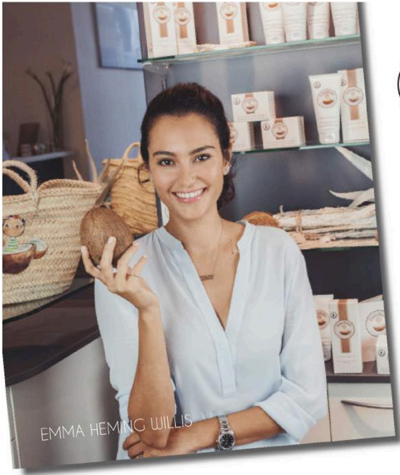
EMMA HEMING WILLIS